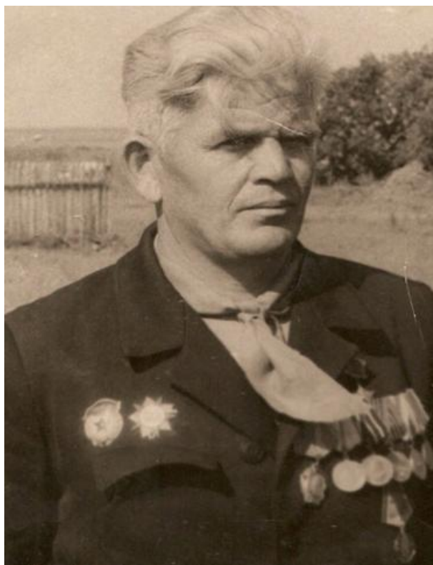
Герой Советского Союза Кухаров Константин Фёдорович

Материал подготовила библиотекарь Стрелецкого библиотечного пункта МКУ «Петуховская межпоселенческая центральная библиотека»