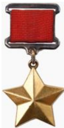
Медаль «Золотая звезда»