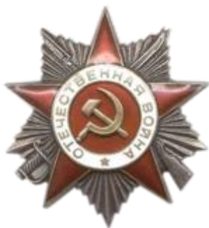
Орден Отечественной войны 1 степени