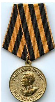
Медаль «За победу над Германией в Великой Отечественной войне 1941—1945 гг.»